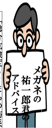
メガネの 祐一郎君の アドバイス 消費生活 アドバイザー 佐藤祐一郎