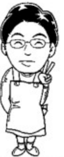
屋敷の眠り ふとんあやのメモ

雪が降るほどの寒さから、さくらが咲きそうなほどのあたたかい日があり、三寒四温のころとなつてまいりましたね。皆さま、いかがお過ごしですか？あたたかくなると鼻もムズムズ。私は1月に入ったとたん耳鼻科にかかりました。